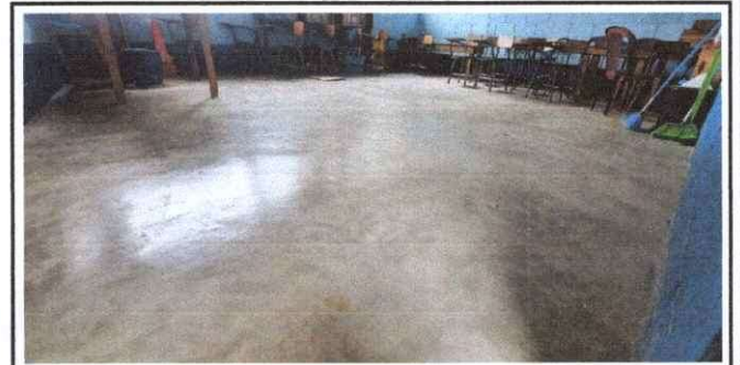
Foto 6: Sustitución de piso de cemento por ceramico. Modulo de Sexto Primaria. 6.75x5.75

Observación: Si es necesario se pueden agregar hojas adicionales y actualizar el número de hojas.