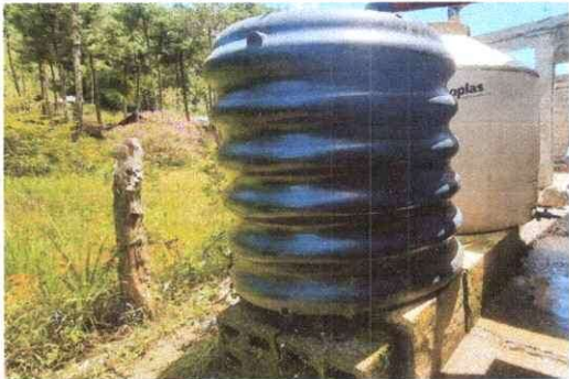
Foto13: Sustitución de deposito de Agua Tinaco, accesorios y base de concreto.