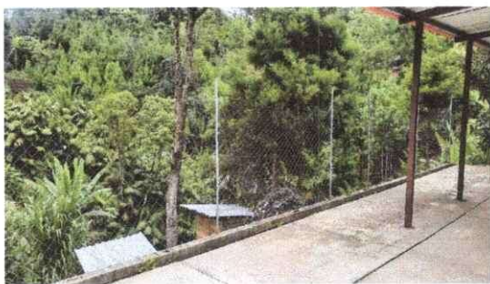
Foto 17: Sustitución de Tubo Galvanizada por columnas y Malla Galvanizada. 18 mts. Lineal.