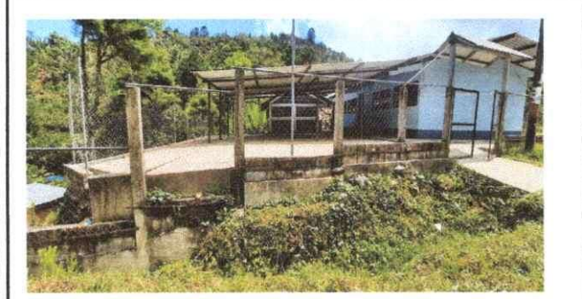
Foto 9: Frontal: Sustrucción de Malla Galvanizada por Muro perimetral de Block más repello.