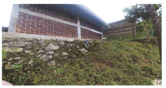
Foto 10: Colocación y Reforzamiento de muro de contención 20mts. Lineal.