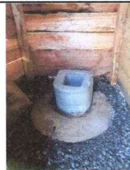
Foto 18: Colocación de torta de cemento, sustitución de letrina de cemento a plástico.

Observación: Si es necesario se pueden agregar hojas adicionales y actualizar el número de hojas.