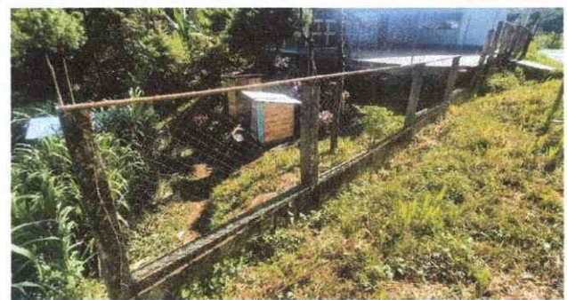
Foto 8: Lateral: Sustrucción de Malla Galvanizada por Muro perimetral de Block más repello exterior.