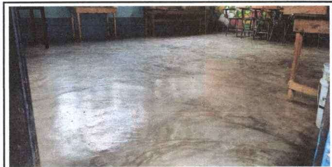
Foto 5: Sustitución de piso de cemento por ceramico. Modulo de Primero Primaria. 6.75x5.75