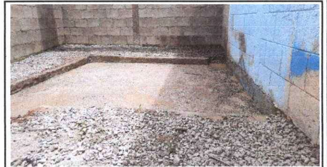
Foto 4: Sustitución de piso de torta de concreto por piso cerámico 7.50x4mts. Modulo Preprimaria.