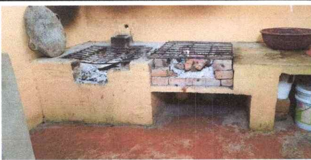
Foto 15: Sustitución de Estufa Rural, colocación de Azulejos y Chimenea.