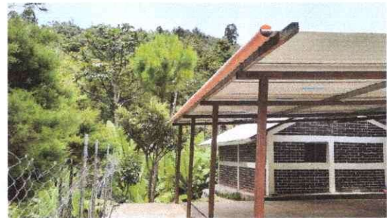
Foto 14: Sustitución de Tubo Pvc 3" a Canal de Metal. 10mts. Largo.