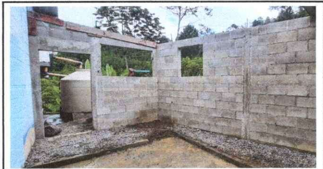
Foto 3: Colocación de Ventanas de Metal mas Vidrio. a). 1.50mts x 85cm y b). 102mts x 85 cm.